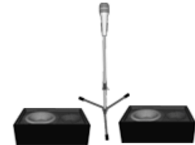
Monitor 5 Monitor 6

1. Bassdrum AKG D112 oder Shure Beta 56 A oder Sennheiser E902 oder Ähnlich 2. Snare Top SM57 3. Snare Bottom SM57 4. Hi-hat Rode NT-5 oder NT-3 oder SM57 oder ähnlich