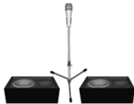
Monitor 1 Monitor 2