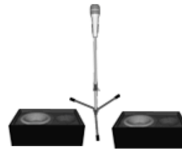
Monitor 3 Monitor 4